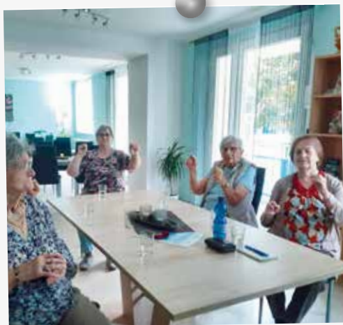
Zur Hockergymnastik werden immer dienstags ab 10.00 Uhr in der Kleist-Stube in Lübben die Türen geöffnet.