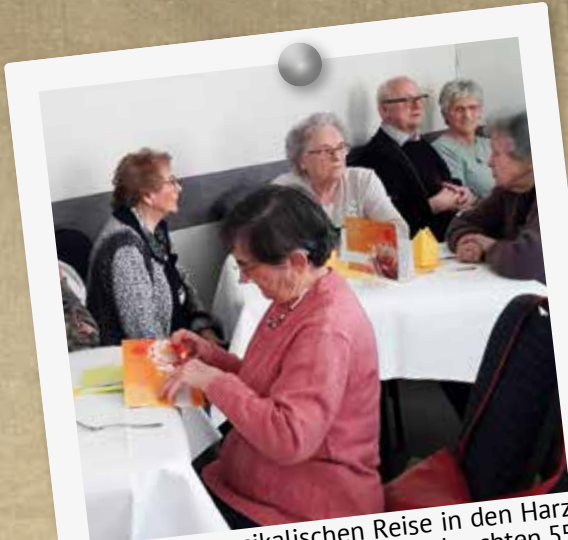
Mit einer musikalischen Reise in den Harz zum „Harzer Jodlermeister“ verbrachten 55 Mitglieder aus Blankenfelde ihren Frauentag Anfang März.