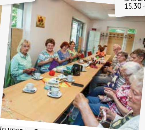
In unserer Begegnungsstätte Regina Wach in Blankenfelde trifft sich die Handarbeitsgruppe an jedem 1. und 3. Montag im Monat.