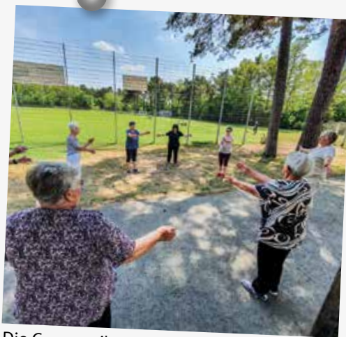
Die Gymnastikgruppe trifft sich immer mittwochs um 14 Uhr in der Begegnungsstätte am Sportplatz und freut sich über neue, sportbegeisterte Turner und Turnerinnen.