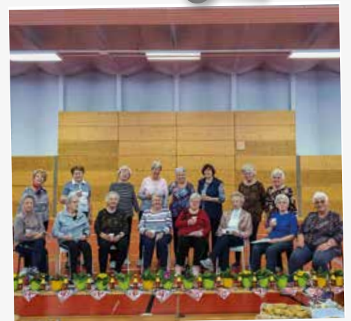
Die Ludwigsfelder Sportgruppe Nord startete ihr Sportprogramm nach langer Corona-Pause mit Eierlikör und einem kleinen Präsent anlässlich des Frauentags.