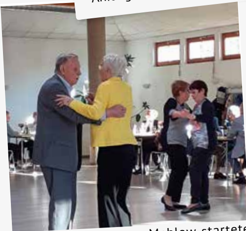
Die Mitgliedergruppe Mahlow startete im März wieder mit ihrer regelmäßigen Tanztee-Veranstaltung, die jeden 2. Mittwoch im Vereinshaus stattfindet.