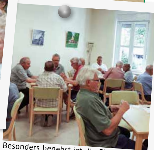
Besonders begehrt ist die Skatrunde im Haus der Begegnung in Mahlow bei den männlichen Mitgliedern, aber auch Frauen gesellen sich gern in die Runde.