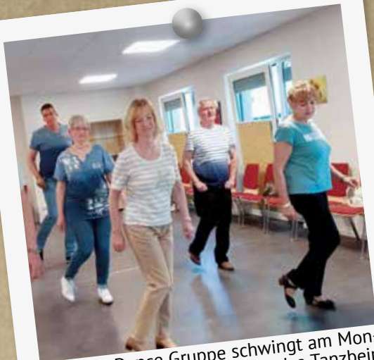
Die Line Dance Gruppe schwingt am Montag und Mittwoch ab 17 Uhr das Tanzbein in der Begegnungsstätte Regina Wach in Blankenfelde.