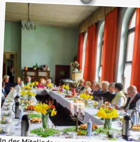
In der Mitgliedergruppe Wernsdorf wurde der Frühling beim Frühlingsfest am 20. April mit Musik, Wissenswertem über Frühblüher und einem Sketch begrüßt.