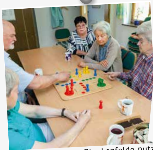
Das Bürgerhaus in Blankenfelde nutzt unsere Betreuungsgruppe immer montags um 9.30 Uhr für Brettspiele.