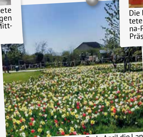
Die OG Zeesen besuchte Ende April die Landesgartenschau in Beelitz inklusive Spargelessen in Klaistow und einer 3-Seen-Rundfahrt mit Kaffeegedeck am Seddiner See.