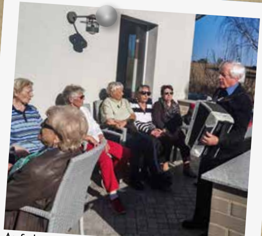
Auf den Spuren Fontanes wanderten 36 Senioren und Seniorinnen aus Friedersdorf und Zernsdorf nach Neuglobsow ins Glasmuseum und zum Stechlinsee.