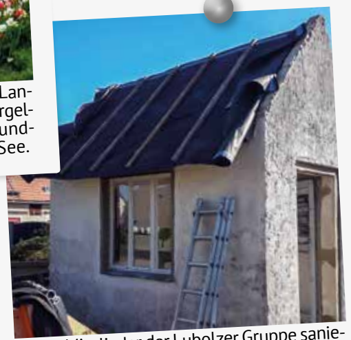
Einige Mitglieder der Lubolzer Gruppe sanierten das alte Wiegehäuschen in Lubolz. Am 260 km langen Gurkenradweg gelegen, soll es Radlern als Rast- und Ruhepol dienen.